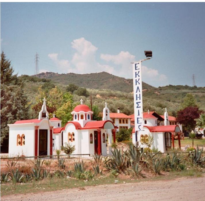
Am Straßenrand zwischen Athen und Lamia werden Kirchen verkauft