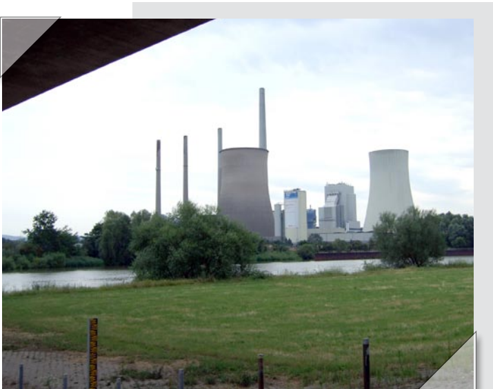
Vom Rhein zum Main IV: Montag, 23. Juli. Ich verlasse den griechisch-römischen Kulturkreis. Hinter dem Limes ist alles plötzlich nur noch maximal halb so alt. Aber der Main ist schließlich auch ein schöner Fluss ...

Diese Rundbriefe werden sich kurzfassen, das heißt, sie werden die Länge einer Seite nicht überschreiten und sie werden weder große Datenmengen, aufwändige Grafiken oder bunte Schriftarten noch voluminöse Anhänge enthalten, die beim Empfang der Mail für Ärger und unangenehme Wartezeiten sorgen könnten. Hinweise auf aktuelle Veranstaltungen oder nähere Informationen werden dagegen mit einem Link auf die Homepage verbunden, so dass jeder Leser und jede Leserin in Sekundenschnelle findet, was sie interessiert. Diesem Prinzip kommt übrigens zugute, dass unsere neugestalteten Programme nun alle Informationen auf einer Seite bieten und dadurch der eigene Ausdruck und seine Handhabung erleichtert werden. Auch die Weiterleitung der Programme im eigenen Freundeskreis lässt sich nun deutlich einfacher gestalten. So laden wir Sie alle herzlich ein, von unserem neuen Angebot Gebrauch zu machen und sich über die Homepage direkt in die Adresse unseres neuen Newsletters einzutragen.