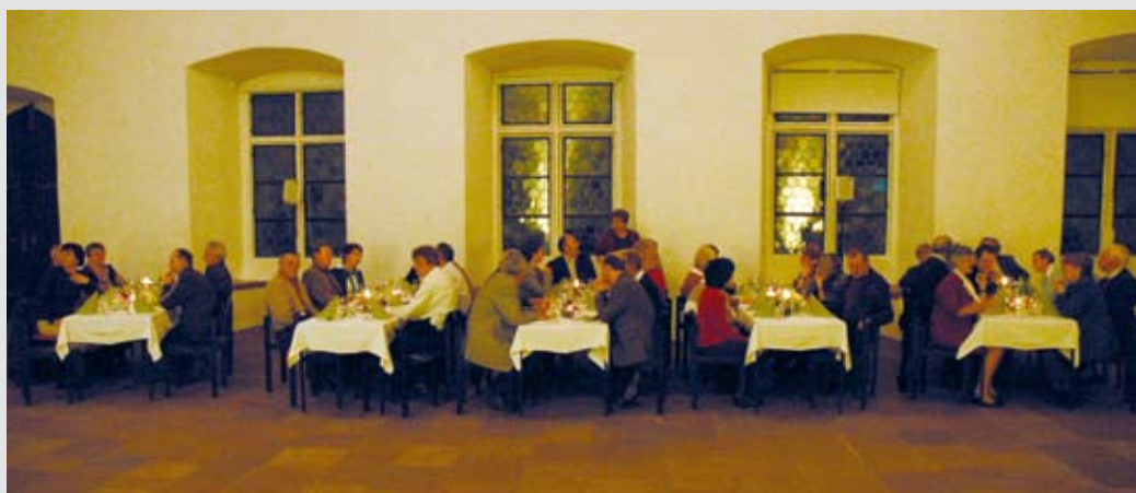
Einweihungsfeier der Holzhack-schnitzelheizung: Stilvoll wie es sich gehört.

Dieses Werk, das in sieben barocken Passionskantaten musikalisch die Gliedmaßen des leidenden Jesus thematisiert, lud dazu ein, vor allem interessante Formstrukturen, Wort-Ton-Bezüge und musikalisch-theologische Ausdeutungen zu entdecken. Im Chor, der allmorgendlich nach dem Frühstück stattfand, wurden u. a. Sätze aus diesem Werk gesungen und dadurch noch einmal völlig anders mit-erlebt.