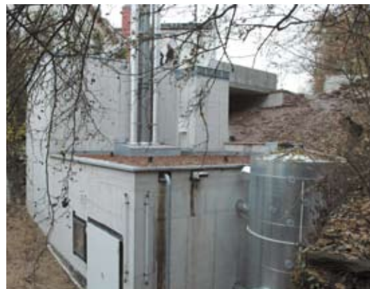
Auf der Anfahrbrücke mit offener Klappe