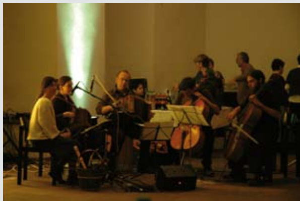
Natürlich mit Live-Musik ...