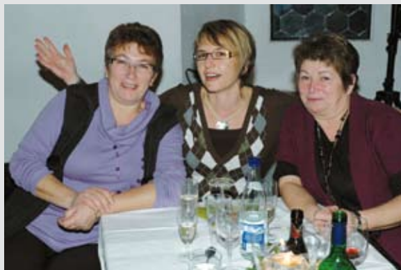
Unsere Mitarbeiterinnen haben es sich verdient!

Einweihungsfeier der Holzhack- schnittelheizung: