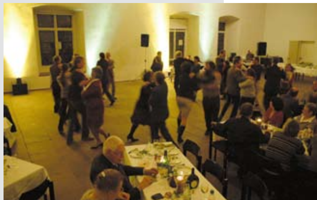
... und Tanz – typisch Burg!