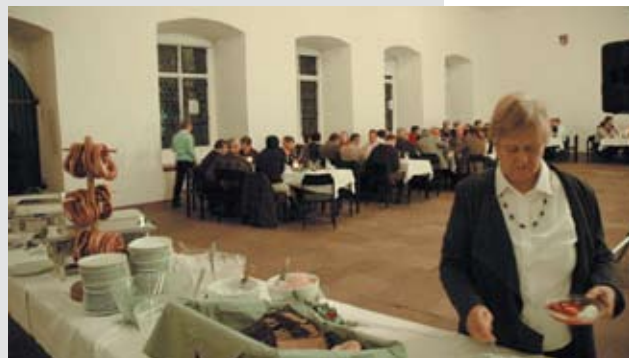
Die neue Küche wird getestet.