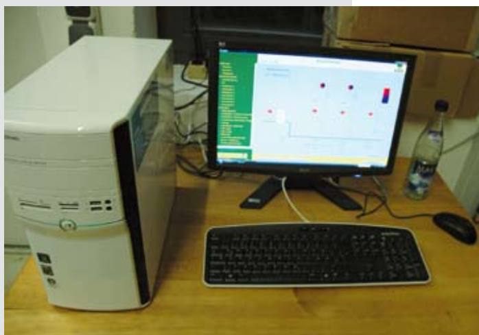
High-Tech: Das ganze Burgklima lässt sich zentral regulieren.