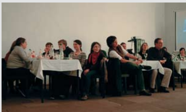
Jung und alt versammelt.