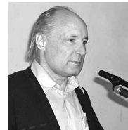
Dr. Eugen Drewermann

Das Rad des Ixion , der Fluch des Sisyphos – sie sind die unvermeidbare Folge einer verzweifelten Suche des Unendlichen im Endlichen. All die Gestalten der griechischen Mythen sind Fragen an unser eigenes Leben und die Art unseres Umgangs mit menschlicher Not.