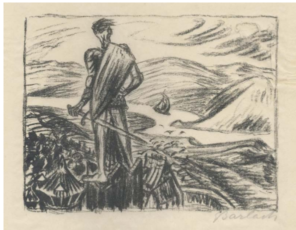
Lithographie Ernst Barlachs zu Goethes Gedicht „Geistesgruß“, erschienen 1924 bei Paul Cassirer, Berlin

Guardini sprach vom Liturgismus. „Das kann ich nicht loben ...“ (1Kor 11,17)