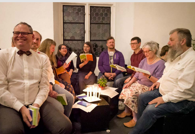
Das Feiern in den sogenannten „Waben“ – eine Rothenfelser Besonderheit.

Der Grund klingt schon an: Personalgemeinden wie Rothenfels laufen förmlich strukturell Gefahr,