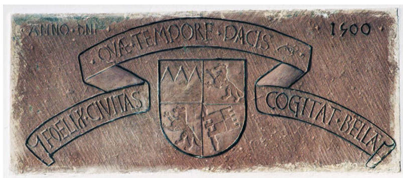
Steintafel im „Pfeilersaal“ mit dem Bibra-Wappen und der Jahreszahl 1500.

Der Rothenfelser Neubau von 1500 sprengte wohl die Ausmaße seines Vorläufers, er wurde stattliche 45 x 14 Meter im Grundriss groß. Er schließt die Lücke zu dem ehemals an den Hofseiten freistehenden Südturm, ist teils unterkellert, stapelt zwei hohe Geschosse und ein gewaltiges Dach aufeinander.