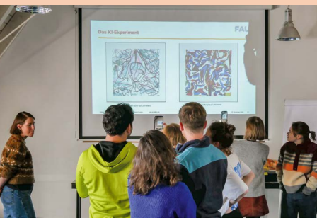
Die Teilnehmenden lernen das KI-Experiment der Friedrich-Alexander Universität kennen.