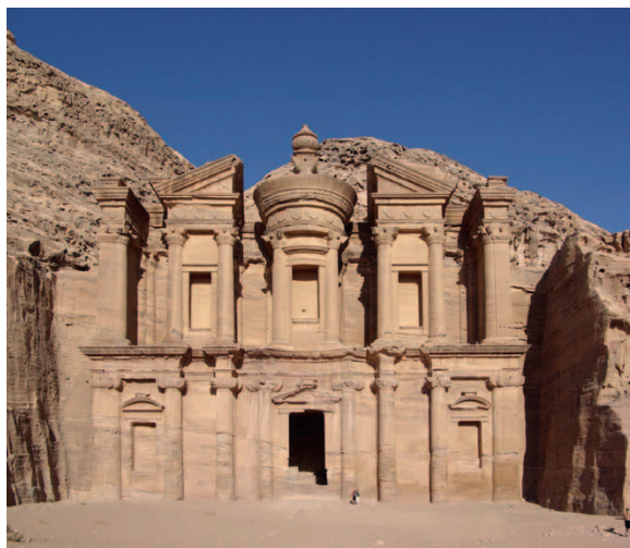
Totentempel ed-Deir in Petra

Kulturhistorische Woche auf Burg Rothenfels mit Vorbereitung einer Reise nach Jordanien