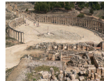
Ovales Forum in Jerash

Die zur Tagung gehörige Reise nach Jordanien planen wir, von SA 9.3. bis SO 17.3.2013 durchzuführen. Folgende Orte wollen wir uns auf jeden Fall anschauen: die Ruinenstadt Jerash (Gerasa); Mosaiken in Madaba, Umm er-Rasas und auf dem Mose-Berg Nebo; die Kreuzfahrerburg in Kerak; Amman mit Forum und Nationalmuseum; 2 volle Tage in der Wüstenstadt Petra; Tagesausflug in das Wadi Rum. Den genauen Reiseverlauf und den Preis entnehmen Sie bitte dem Flyer, der bis zum Herbst erscheinen soll. Wer zur Tagung angemeldet ist, wird umgehend informiert.